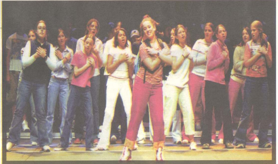
Una escena de Regals , una òpera pensada perquè els nens comencin a disfrutar de l'art líric des de totes les perspectives.

Aquesta iniciativa es va posar en marxa el 1998 amb l'estrena a Espanya de Brunðibár , de Hans Krása (1998-99), i va continuar amb Eco , de Philippe Vallet (2000-01). En els seus gairebé cinc anys d'història, el projecte ha comptat amb la contribució de més de 3.200 alumnes com a cantants i ha convençut gairebé 13.000 espectadors. "La proposta em va seduir de seguida", reconeix Lecina. "El gènere líric m'atrau molt i aquesta obra, a més a més, té moltes particularitats". La més notable de totes és l'esmentat cor, que en aquesta producció compta amb 300 nens en escena -diferents en cada representació-, així com la participació de la Jove Orquestra Na-